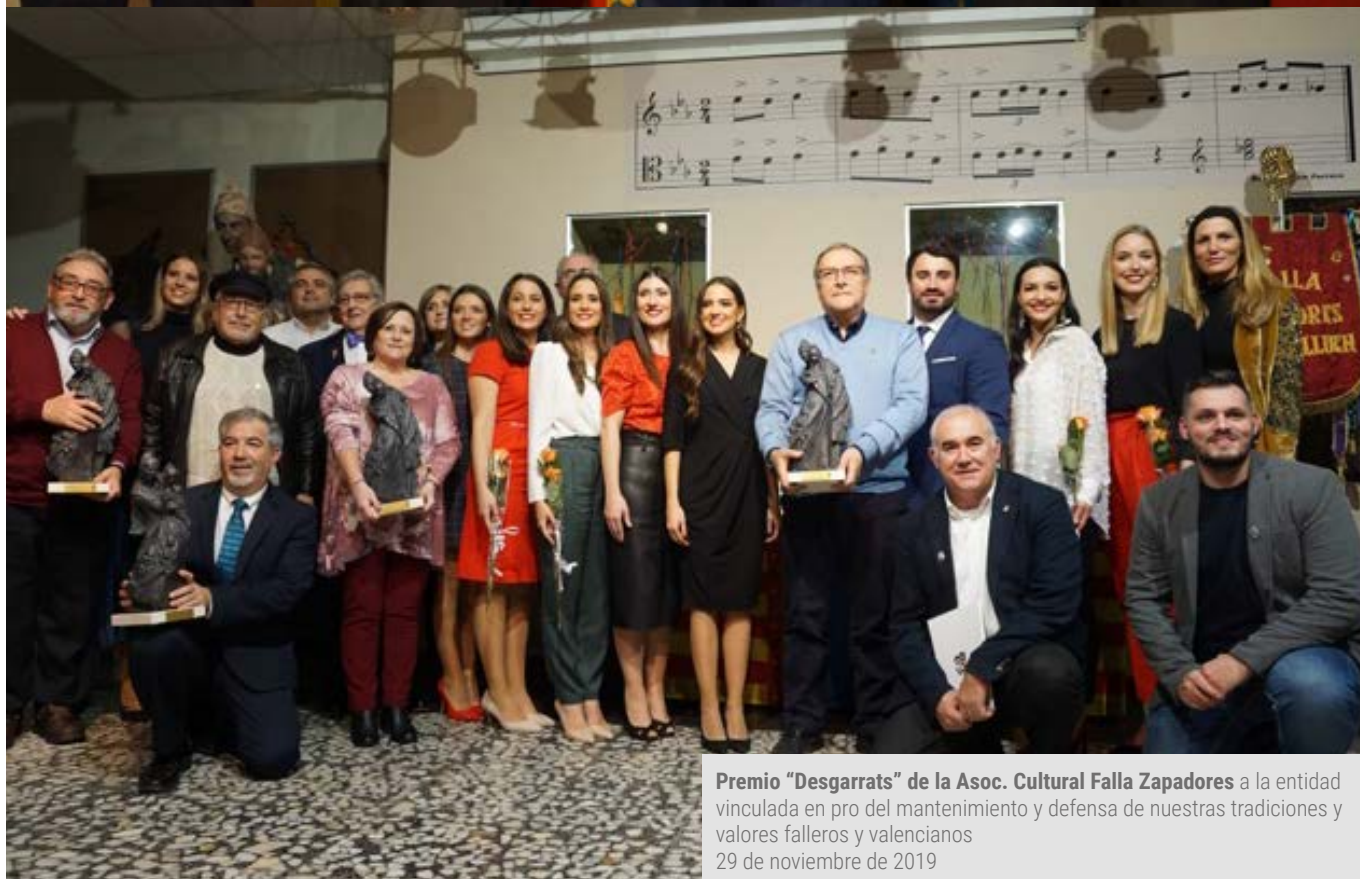
Premio "Desgarrats" de la Asoc. Cultural Falla Zapadores a la entidad vinculada en pro del mantenimiento y defensa de nuestras tradiciones y valores falleros y valencianos 29 de noviembre de 2019