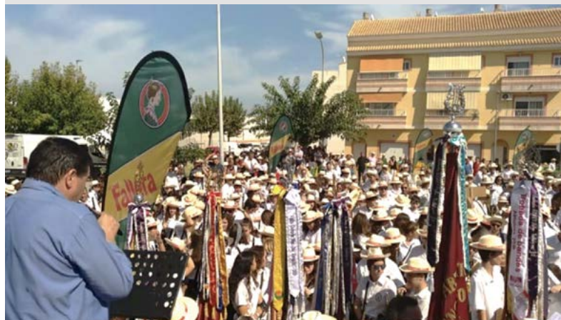
Actividad comarcal La Safor-Valldigna