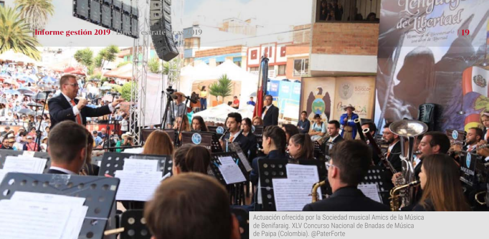
Actuación ofrecida por la Sociedad musical Amics de la Música de Benifaraig. XLV Concurso Nacional de Bnadas de Música de Paipa (Colombia). @PaterForte