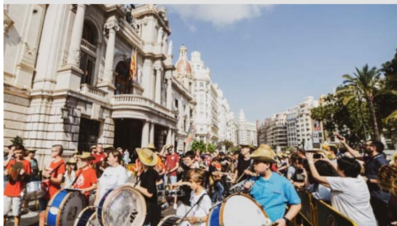
Actividad comarcal València ciudad