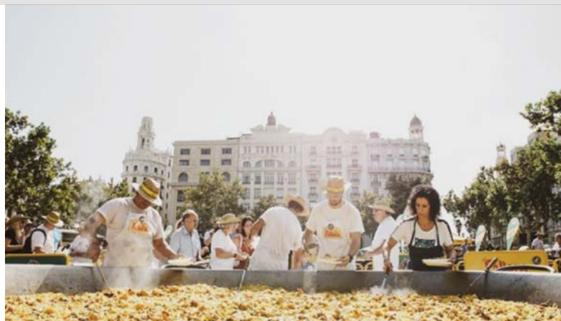
Actividad comarcal València ciudad

Como ejemplo, el evento celebrado en València: I Trobada d'Escoles de Música de la Ciutat de València , el pasado 13 de octubre, logró reunir a más de 1.000 alumnos y 350 profesores de las escuelas de música de la ciudad, una iniciativa desarrollada en la plaza del Ayuntamiento con actividades didácticas y encuentros musicales en el que participaron 20 sociedades musicales federadas de la ciudad de València, además de gran cantidad de público, especialmente familias y público infantil. Una experiencia muy satisfactoria que dará paso a nuevas vías de colaboración entre FSMCV y La Fallera para un futuro.