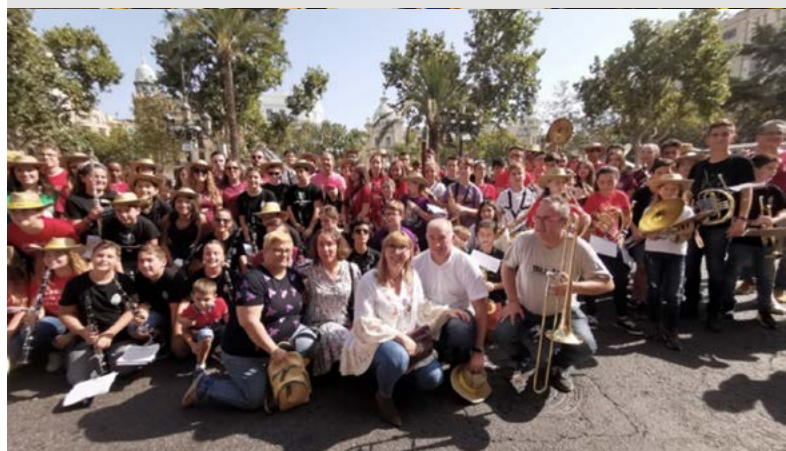
Actividad comarcal València ciudad