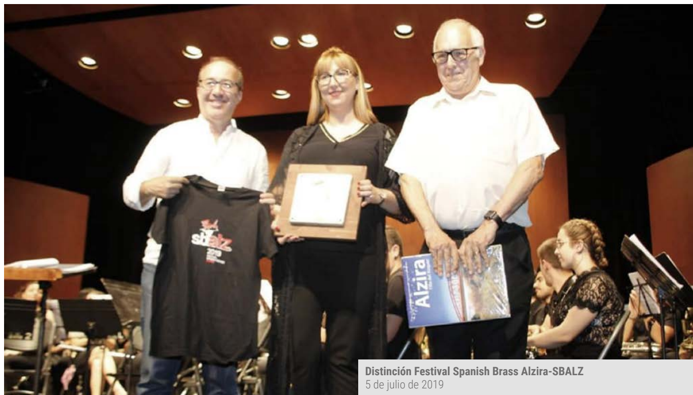
Distinción Festival Spanish Brass Alzira-SBALZ 5 de julio de 2019