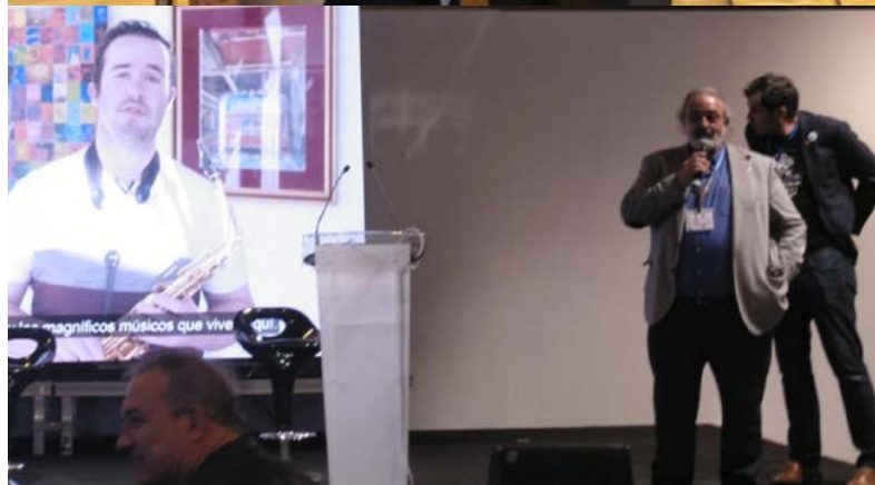
Presentación del proyecto Music Immersion Travel en el área de "Turismo experiencial" en FITUR