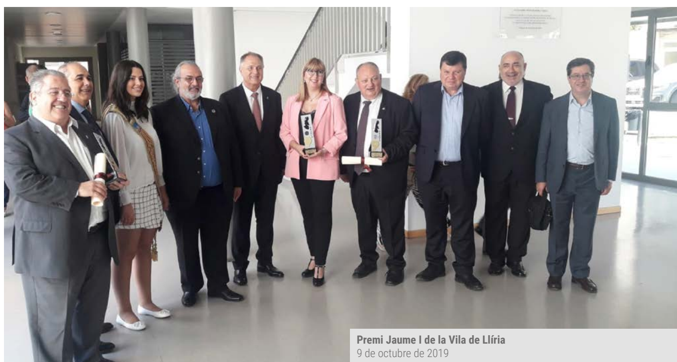
Premi Jaume I de la Vila de Lliria 9 de octubre de 2019