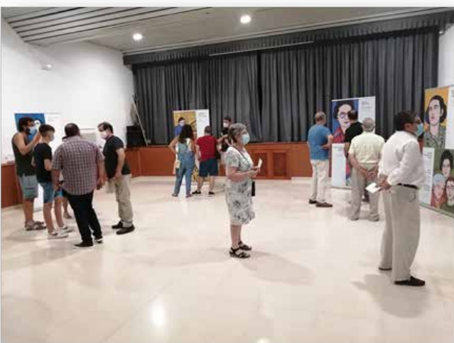
Exposición “Les nostres compositores” en la Sociedad Musical “Santa Cecilia” de Macastre, julio de 2020.

Con un afán divulgativo, la historia de estas compositoras valencianas ya ha recorrido varios puntos de nuestra Comunidad de la mano de las sociedades musicales, como es el caso de Albaida, Macastre, Faura, Algímia de Alfara, Massamagrell, entre otros, una muestra que continua su programación en 2021 y 2022.