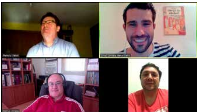
Detalle de la visita online realizada a la Societat Musical "La Constància" de Moixent. 23/04/2020.

Debido al contexto de la pandemia, algunas de las visitas programadas fueron aplazadas para el próximo ejercicio, si bien la conversión del servicio a online ha permitido continuar dando apoyo directo a las sociedades musicales, sobre todo en un momento tan complejo. De este modo, durante el año 2020 se han realizado un total de 32 visitas , de las cuales 18 pertenecen a la provincia de Valencia, 13 a Alicante, y 1 a Castelló. Así mismo, se han adaptado los objetivos generales incluyendo cuestiones de interés sobre la pandemia. Por lo que respecta a la valoración de este Servicio por parte de las sociedades musicales, cabe destacar que el 89% valora con un 5 sobre 5 esta iniciativa y el 100% de las sociedades musicales visitadas la recomendaría a otras sociedades musicales.