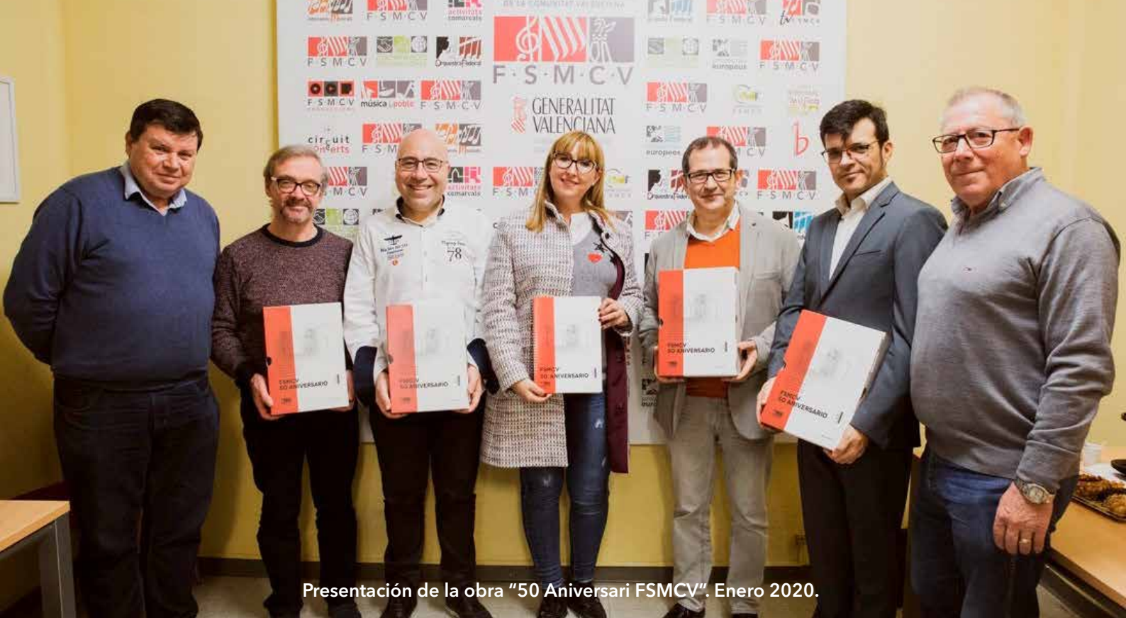
Presentación de la obra "50 Aniversari FSMCV". Enero 2020.

En paralelo, el sello editorial FSMCV EDICIONS, especializado en la edición de partituras y estudios especializados, ha editado en 2020 las siguientes obras