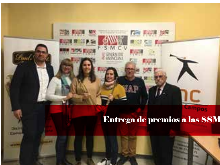
Entrega de premios a las SSMM ganadoras del concurso de Instagram, enero de 2020