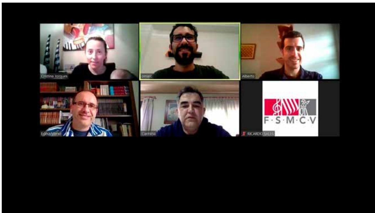
Detalle de la visita online realizada a la Sociedad Musical La Alianza de Torremanzanas. 30/04/2020.

* Durante el ejercicio 2020, la FSMCV el servicio de asesoría jurídica ha informado a las ssmm federadas de todas las novedades y comunicaciones oficiales derivadas de la pandemia. En total, se han enviado 42 publicaciones oficiales del DOGV respecto al COVID-19.