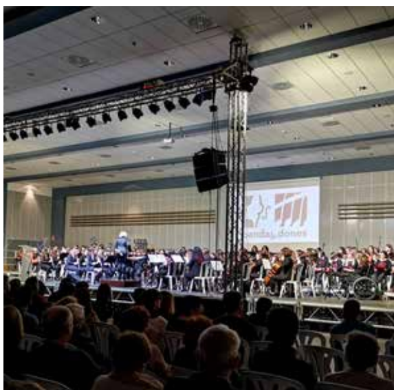
Imagen del concierto de la Banda Simfònica de Dones celebrado en Oliva, el 7 de marzo de 2020.

El concierto de Amposta fue el primero de una serie de conciertos que la Banda Simfònica de Dones protagonizó en 2020 en el mes de marzo, como los conciertos celebrados en Oliva, el 7 de marzo, y en Dénia, el 8 de marzo, con motivo del Día de la Mujer.