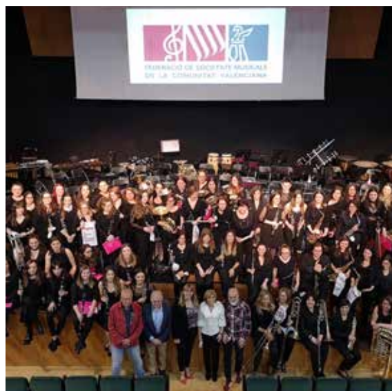
Imagen del concierto de la Banda Simfònica de Dones celebrado en Denia, el 8 de marzo de 2020.