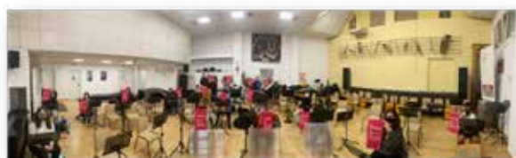
La Agrupación Artística musical de Dénia participando de la campaña.

Con esta campaña se pretende dar a conocer el informe del Consell Escolar «Machismos cotidianos, base de la violencia contra las mujeres», documento que incluye recomendaciones para acabar con el machismo que de manera sutil penetra en nuestro día a día. La campaña se ha hecho extensiva a las sociedades musicales, a través de sus conciertos y actividades, con el fin de consolidar políticas y proyectos socioeducativos conducentes a erradicar los machismos cotidianos que pueden desembocar en violencia de género.